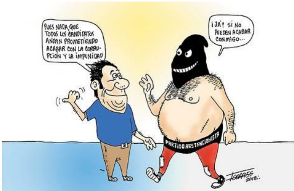
(La Voz de la Frontera, “Difícil de Vencer”, por Fco. Corpus)