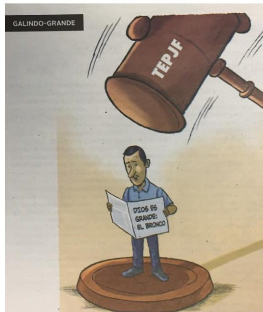
(La Crónica, "Galindo-Grande")