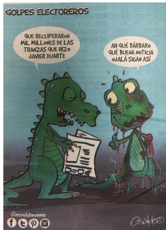
(La Voz de la Frontera, “Golpes Electoreros” por Osvaldo M.)