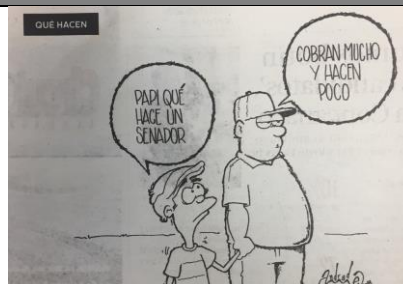
(La Crónica, “Qué Hacen”, por Andrade)