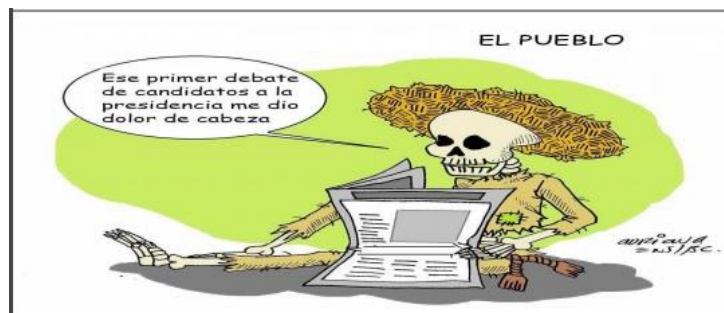
(El Mexicano, "El Pueblo", por Adriana Ens.)