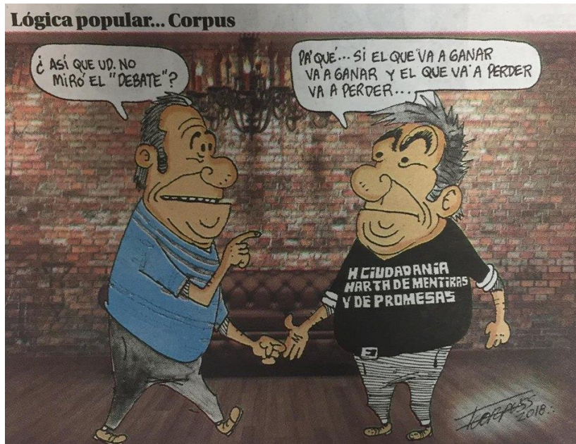
(La Voz de la Frontera, "Lógica Popular", por Fco. Corpus)