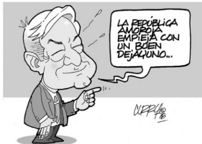
(El Vigía, "Barriga Llena", por Curry)