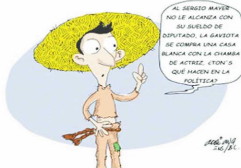
(El Mexicano, "Carrera Equivocada", por Adriana Ens.)