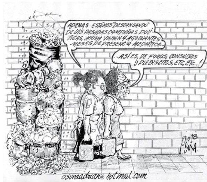
(El Vigía, por Osuna)