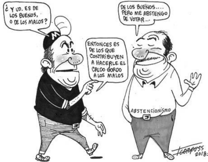
(La Voz de la Frontera, "Ubicación Política", por Francisco Corpus)