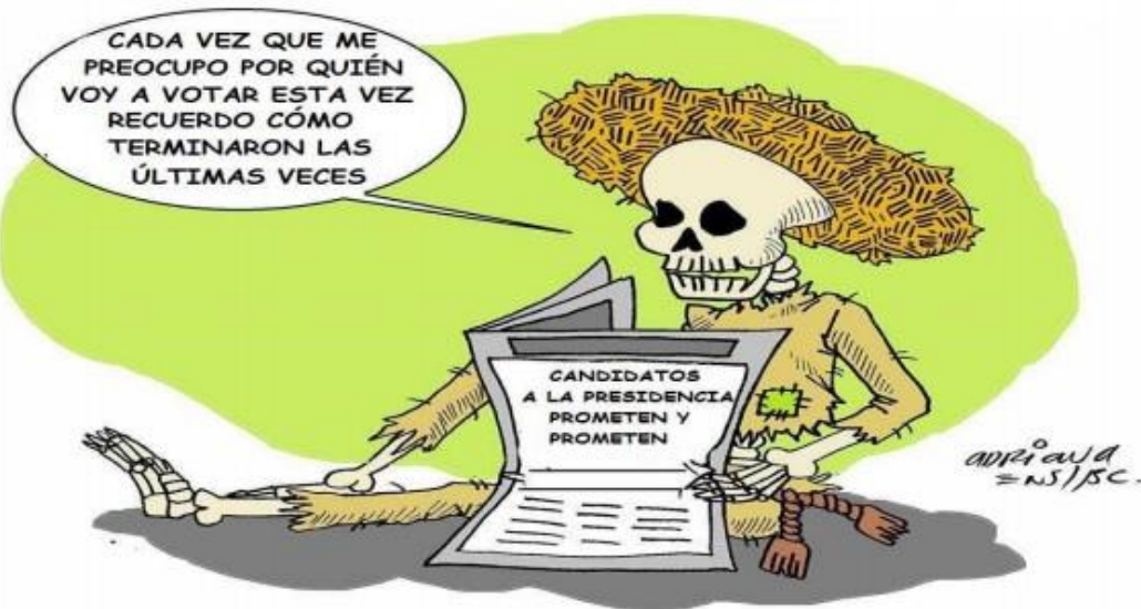
(El Mexicano, "Y entonces me preocupo más", por Adriana ENS)