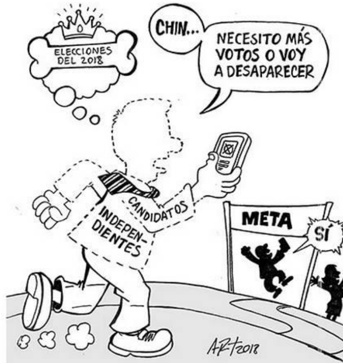
(La Voz de la Frontera, "Finalizando", por ART)