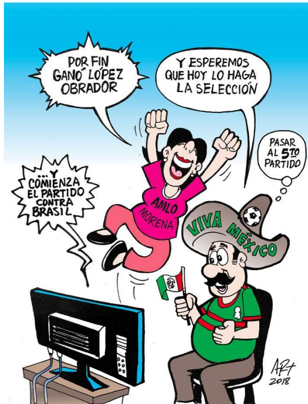
(La Voz de la Frontera, "Triunfo Esperado", por Art.)