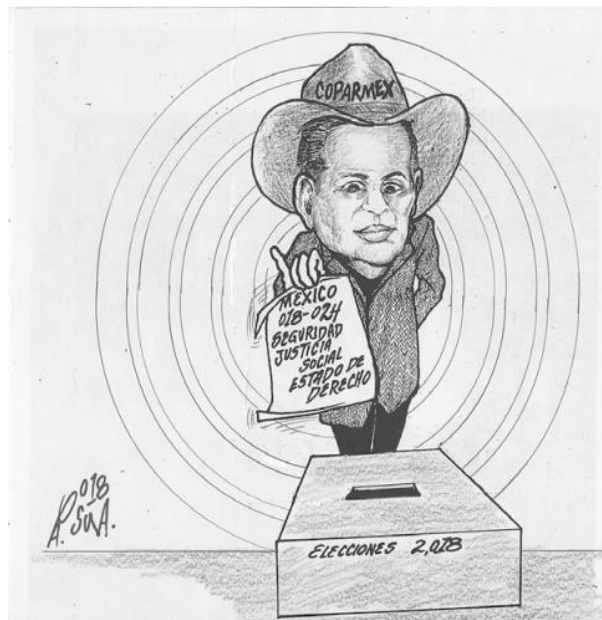
(El Vigía, por Osuna)