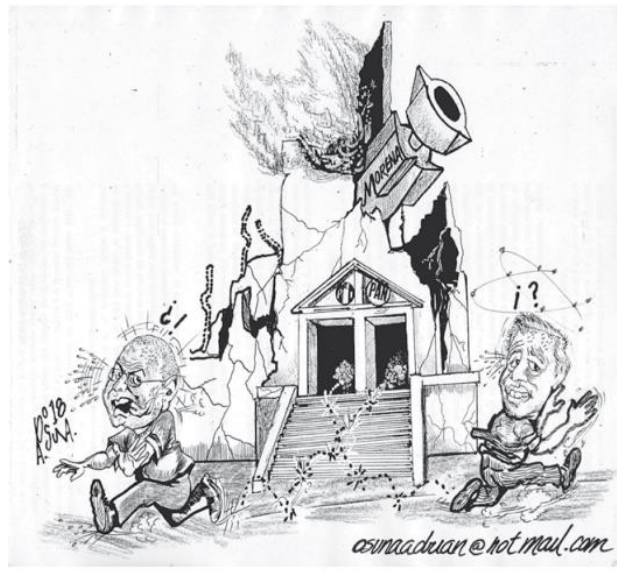
(El Vigía, por Osuna)