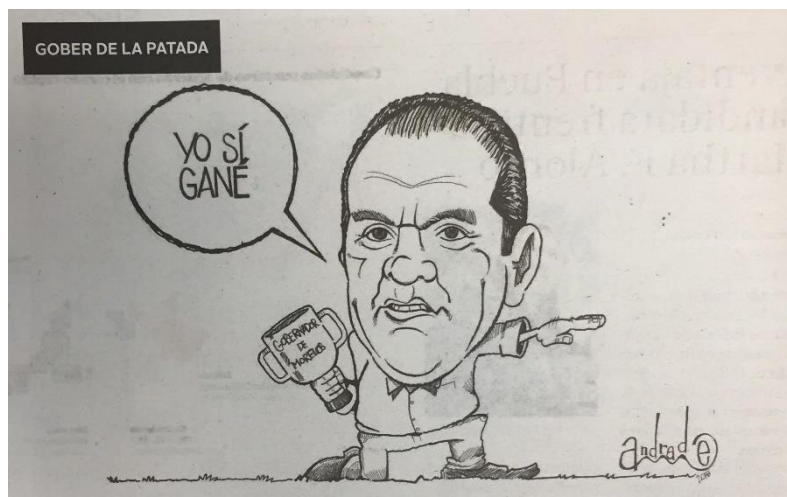
(La Crónica, "Gober de la Patada", por Andrade)