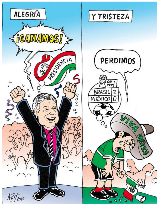
(La Voz de la Frontera, "Contraste Nacional", por Art.)