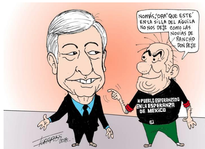
(La Voz de la Frontera, "Amlo Prejidente...", por Francisco Corpus)