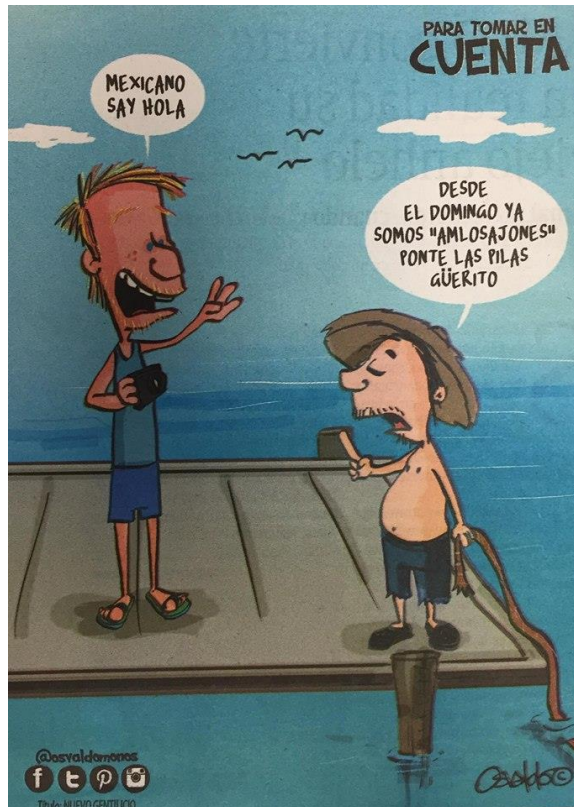
(La Voz de la Frontera, "Para Tomar en Cuenta", por Osvaldo M.)