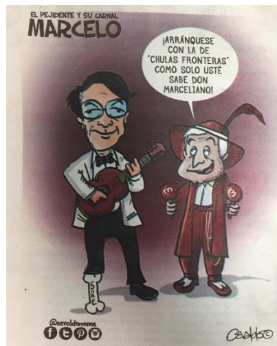
(La Voz de la Frontera, "El Pejidente y su Carnal Marcelo", por Osvaldo M.)