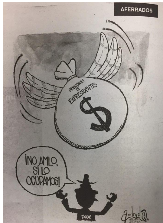
(La Crónica, "Aferrados", por Andrade)