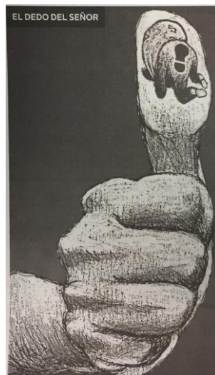
(La Crónica, "El Dedo del Señor")