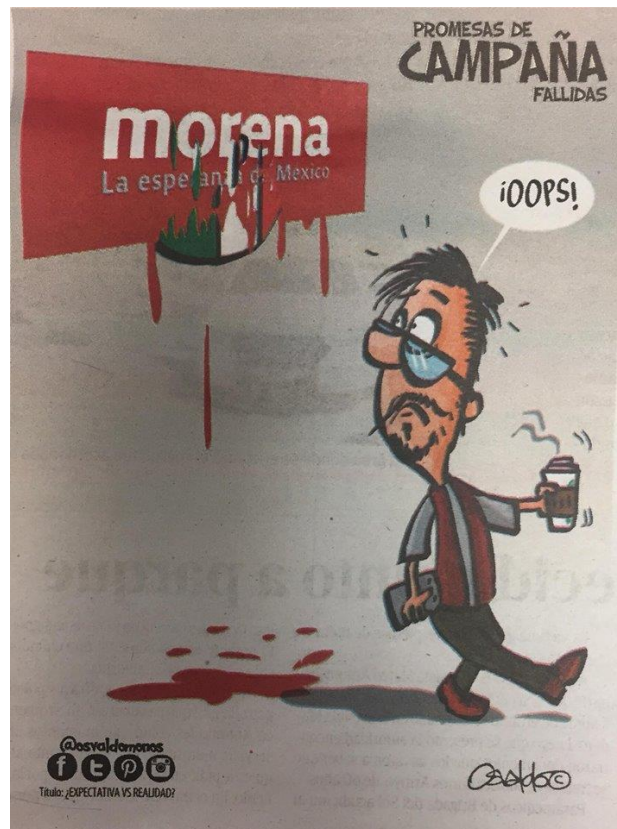
(La Voz de la Frontera, "Promesas de Campaña Fallidas", por Osvaldo M.)