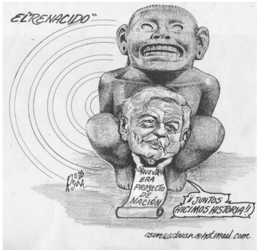
(El Vigía, "El Renacido", por Osuna)