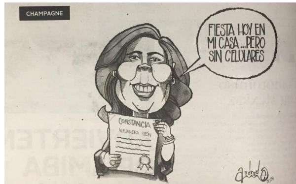
(La Crónica, "Champagne", por Andrade)