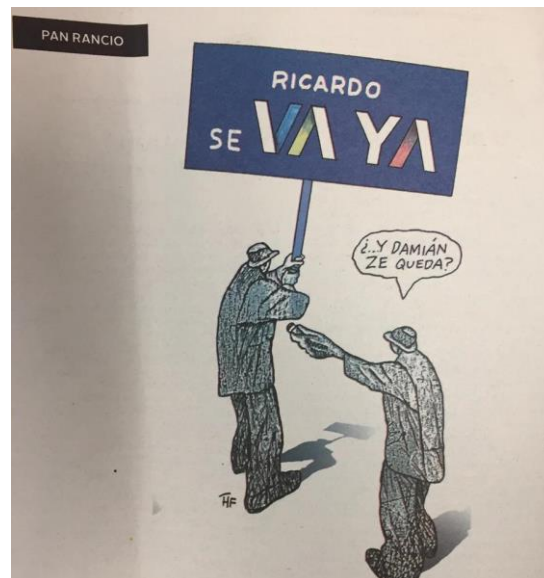
(La Crónica, "Pan Rancio", por HF)