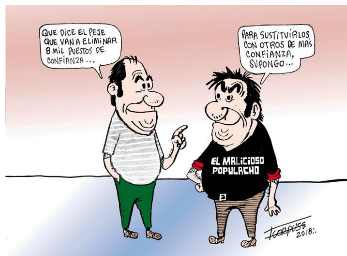
(La Voz de la Frontera, "La Ley de la Costumbre", por Francisco Corpus)