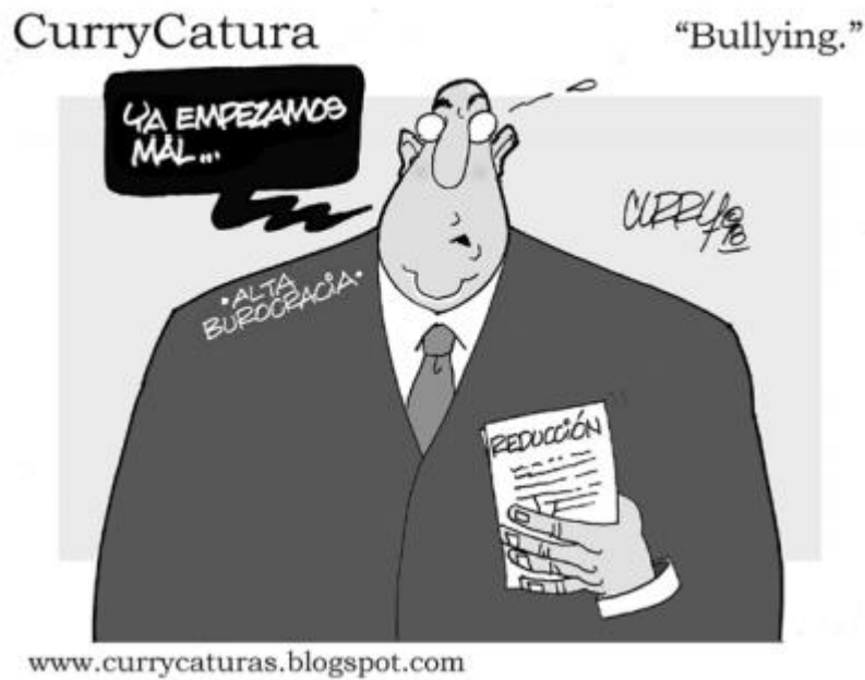
(El Vigía, "Bullying", por Curry)