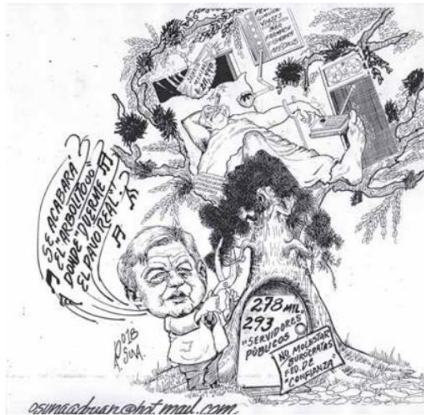
(El Vigía, por Osuna)