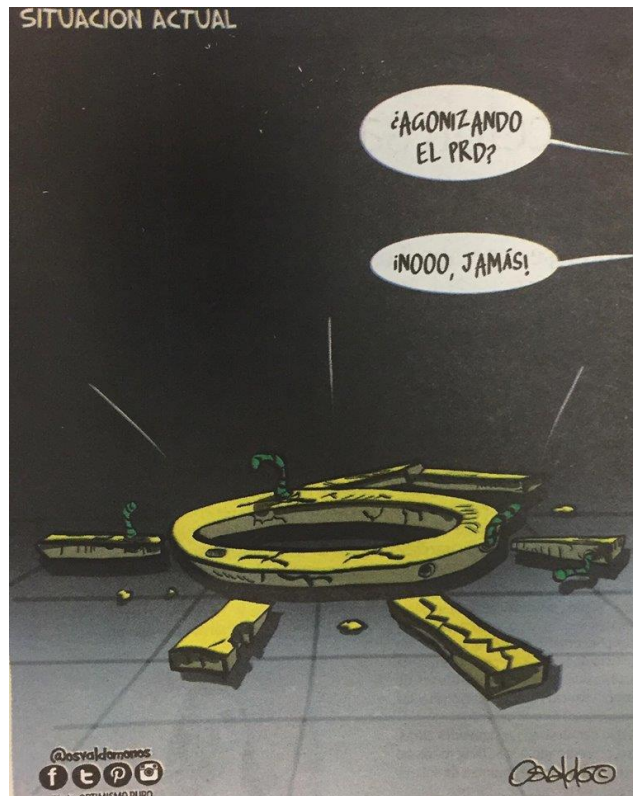
(La Voz de la Frontera, "Situación Actual", por Osvaldo M.)