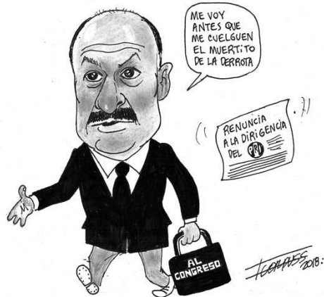
(La Voz de la Frontera, "Escapatoria", por Francisco Corpus)