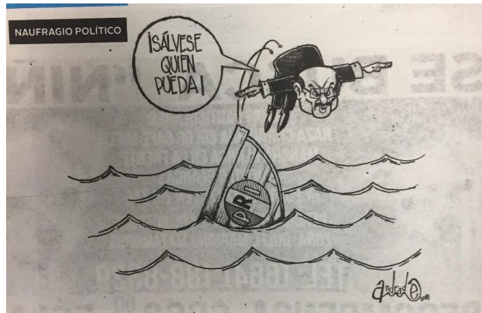
(La Crónica, "Naufragio Político", por Andrade)