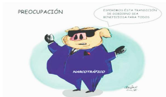
(El Mexicano, "Preocupación", por Adriana Ens.)