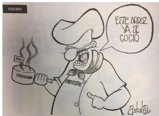
( La Crónica , “Cocido”, por Andrade)