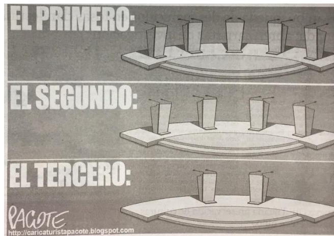
(Zeta, por Pacote)