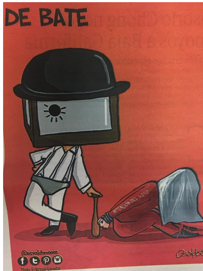
(La Voz de la Frontera, "De Bate", por Osvaldo M.)