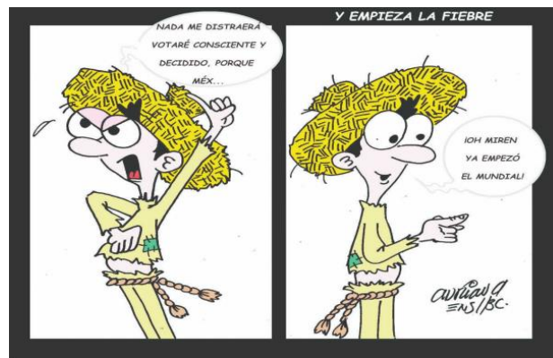
(El Mexicano, "Y Empieza la Fiebre", por Adriana Ens.)