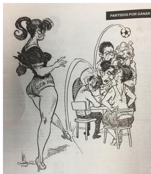
(La Crónica, "Partidos Por Ganar", por Carreño)