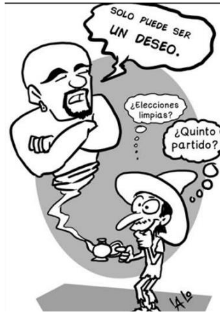
(Infobaja, "Segundos Más", por Lalo Saavedra)