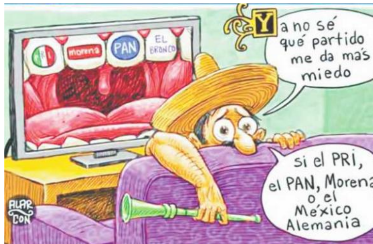
(El Mexicano, "Tal Cual", Alarcón)