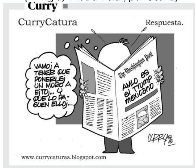
(El Vigía, "Respuesta", por Curry)