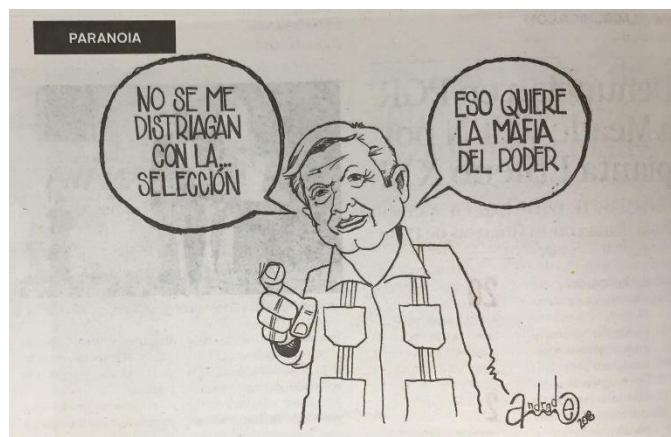
(La Crónica, "Paranoia", por Andrade)