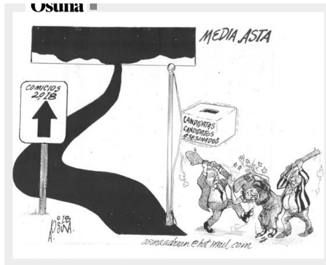
(El Vigía, "Media Asta", por Osuna)