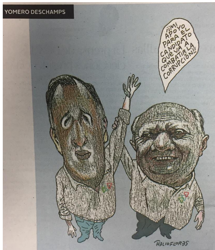
(La Crónica, "Yomero Deschamps", por Flores)