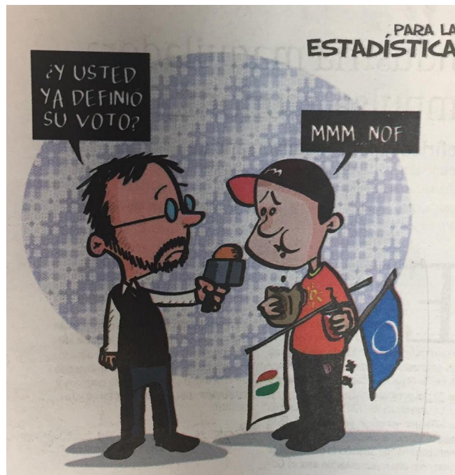
(La Voz de la Frontera, "Para la Estadística", por Osvaldo M.)