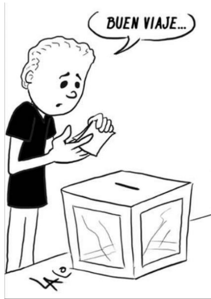
(InfoBaja, "Segundos Más", por Lalo Saavedra)