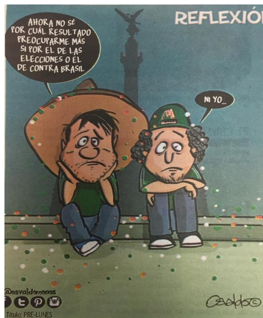
(La Crónica, "Reflexión", por Osvaldo M.)