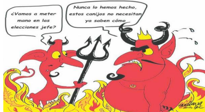
(El Mexicano, por Adriana Ens.)