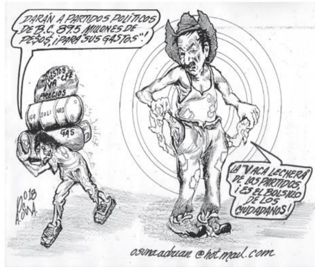
(El Vigía, por Osuna)