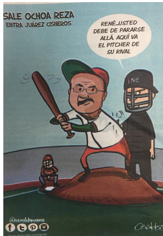
(La Voz de la Frontera, "Sale Ochoa Reza, Entra Juárez Cisneros", por Osvaldo M.)