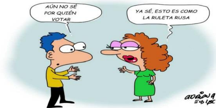
(El Mexicano, "Ruleta a la Mexicana", por Adriana E.)