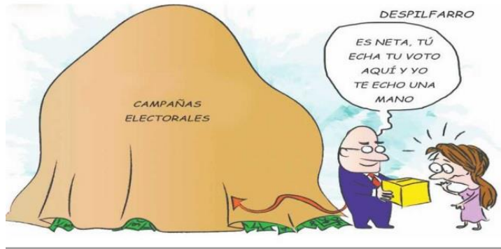
(El Mexicano, "Despilfarro")