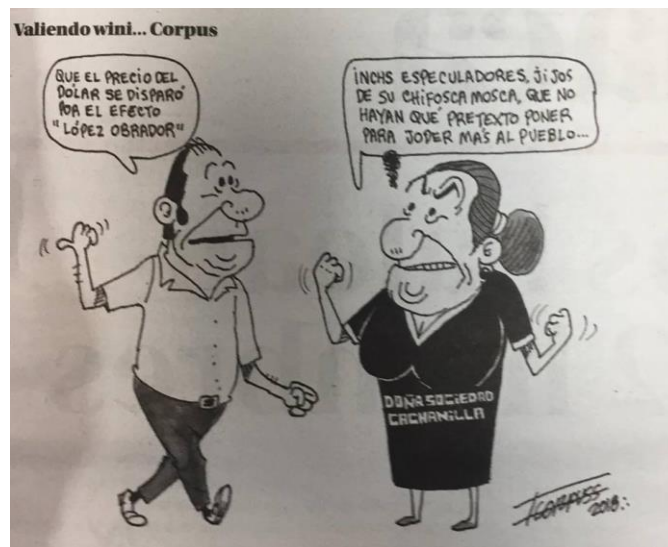
(La Voz de la Frontera, "Valiendo Wini...Corpus", por Fco. Corpus)