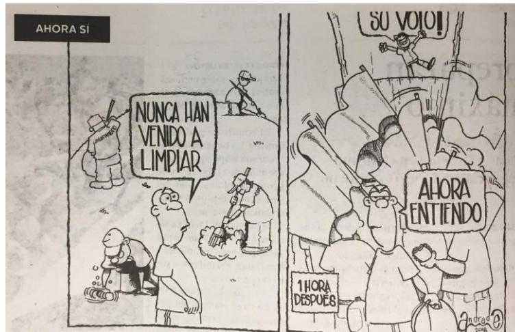
(La Crónica, "Ahora Si")

CurryCatura El pensamiento a través de Nopales.