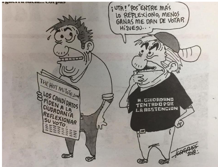
(La Voz de la Frontera, "Por la Guerra Sucia", por Fco. Corpus)