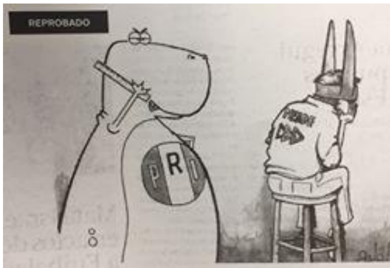
(La Crónica, "Reprobado", por Andrade)