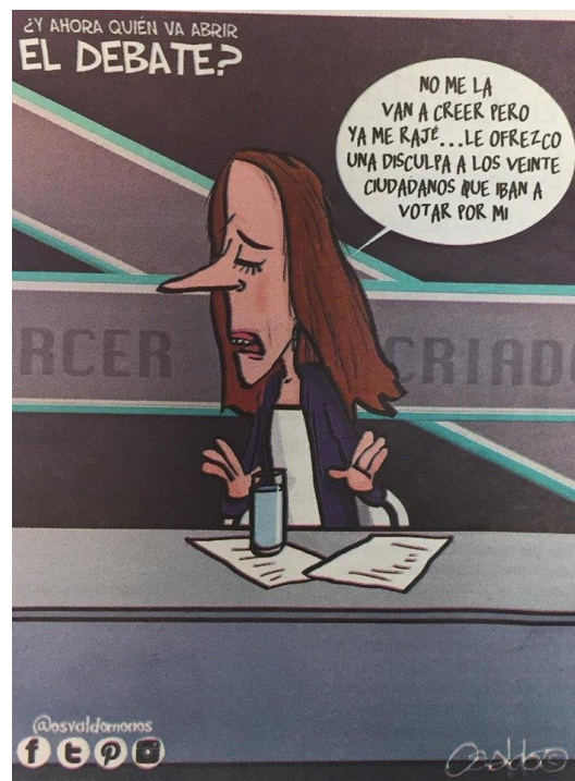
(La Voz de la Frontera, “¿Y ahora quién va a abrir el debate?”, por Osvaldo M)