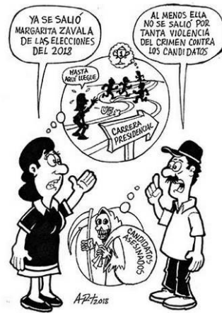
(La Voz de la Frontera, “No pudo”, por Art.)