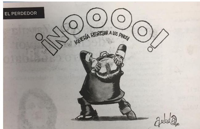
(La Crónica, "El Perdedor", por Andrade)