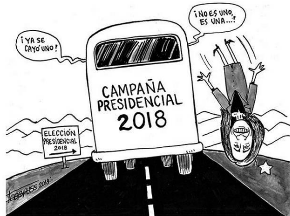
(La Voz de la Frontera, “Bajarse Con Estilo”, por Francisco Corpus)