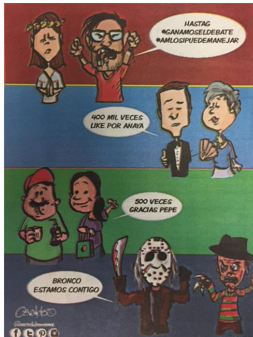
(La Voz de la Frontera, por Osvaldo M.)