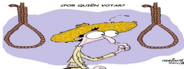
(El Mexicano, “¿Por quién Votar?”, por Adriana Ens.)