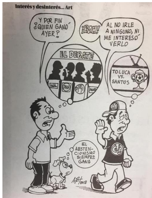
(La Voz de la Frontera, "Intereses y Desintereses", por Art.)