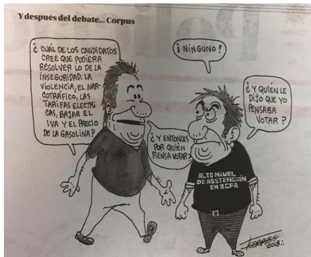
(La Voz de la Frontera, “Y después del debate...”, por Francisco Corpus)