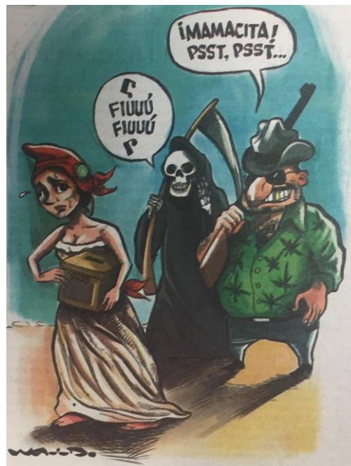
( La Voz de la Frontera , “Democracia Acosada”, por Osvaldo M.)