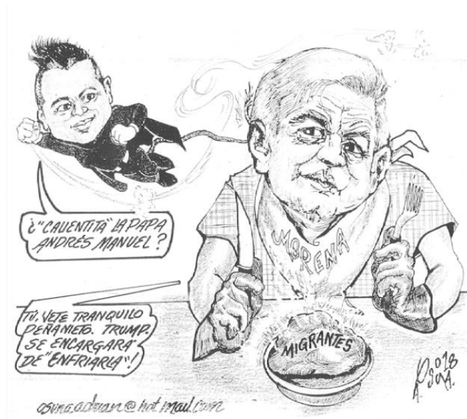
( El Vigía , por Osuna)