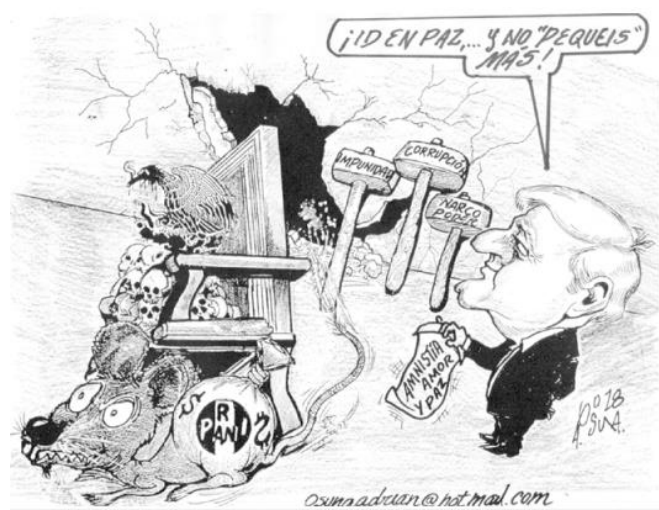
(El Vigía, por Osuna)