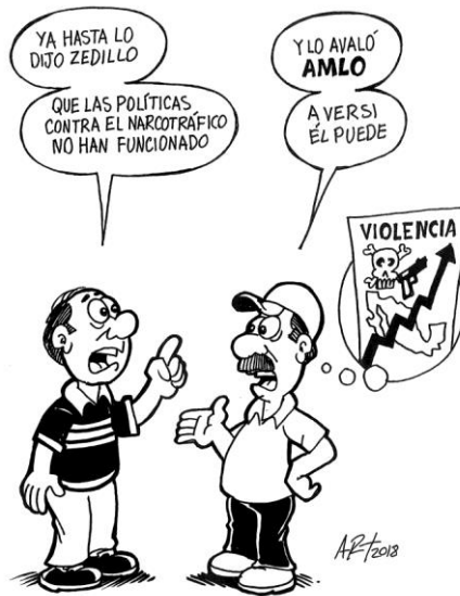
(La Voz de la Frontera, "Políticas Incorrectas", por Art.)