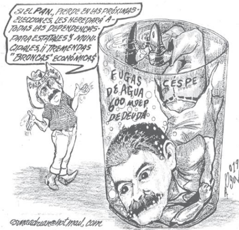
(El Vigía, por Osuna)