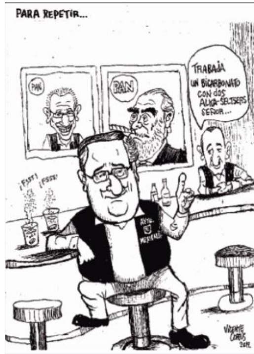
(Contacto, "Para Repetir", por Vicente Corpus)