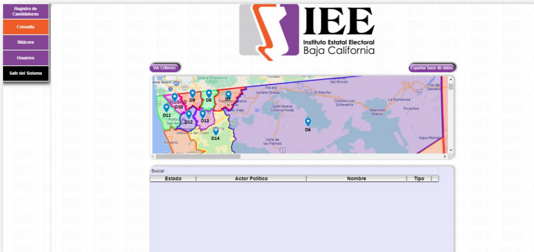
Imagen 4 de Consulta, opción "Mapa distrital"