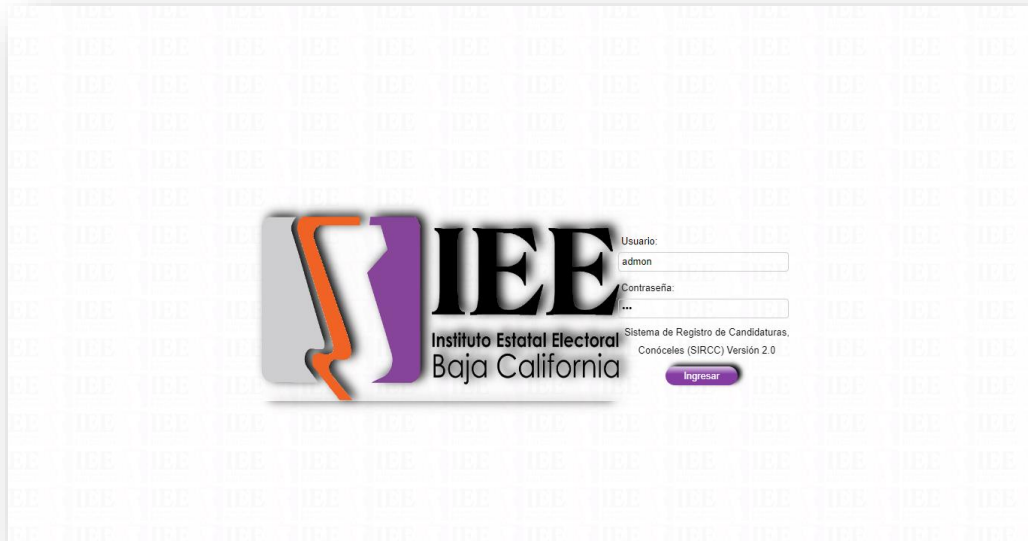
Imagen 1 de pantalla de inicio de sesión