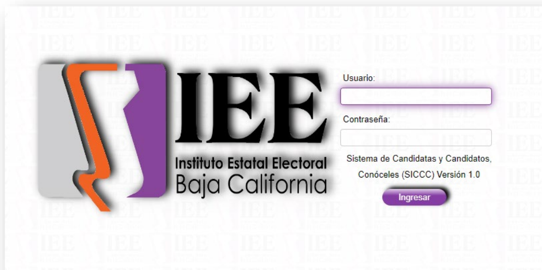
Vista de pantalla de inicio de sesión

Los días 11, 15 y 18 de septiembre de 2023, los integrantes de la Comisión de Seguimiento al Sistema llevaron a cabo reuniones de trabajo con personal de la Coordinación de Informática y Estadística Electoral del Instituto Electoral , en las que se realizaron pruebas de la plataforma web con el fin de conocer los avances en el desarrollo del Sistema Conóceles . De esta reunión se rescataron ideas encaminadas al mejoramiento de elementos críticos, como la interfaz gráfica, redacción y accesibilidad de la información.