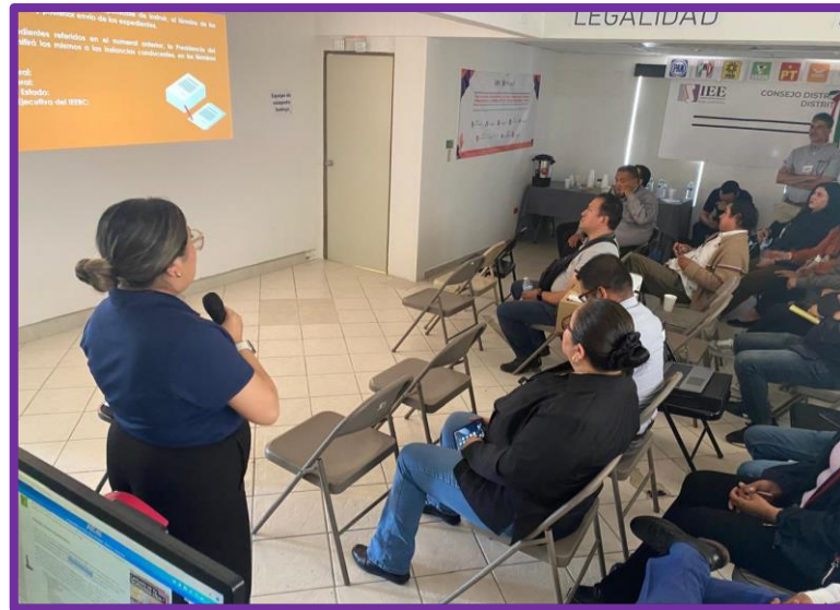
Tijuana Baja California, a 20 de mayo. - Capacitación brindada a las Consejerías Distritales correspondientes a los Distritos Electorales 07, 14 y 15, por parte del personal del Departamento de Procesos Electorales.