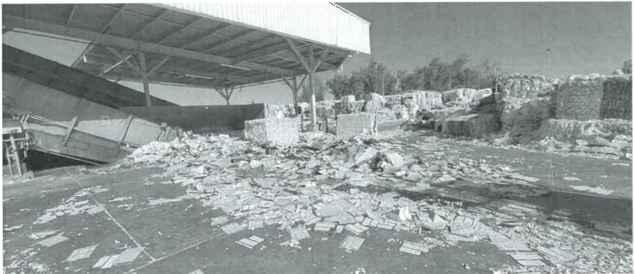
FECHA: 03 de junio de 2025. LUGAR: Islas Agrarias km 10.5, Colonia Mariano Abasolo, Mexicali, Baja California.