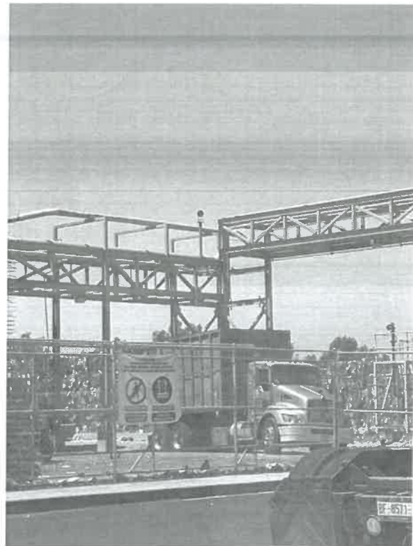
FECHA: 12 de junio de 2025. LUGAR: Carretera Mexicali a San Felipe Km 2, Lote 17, Colonia Dos División 2, C.P. 21399, Mexicali, Baja California