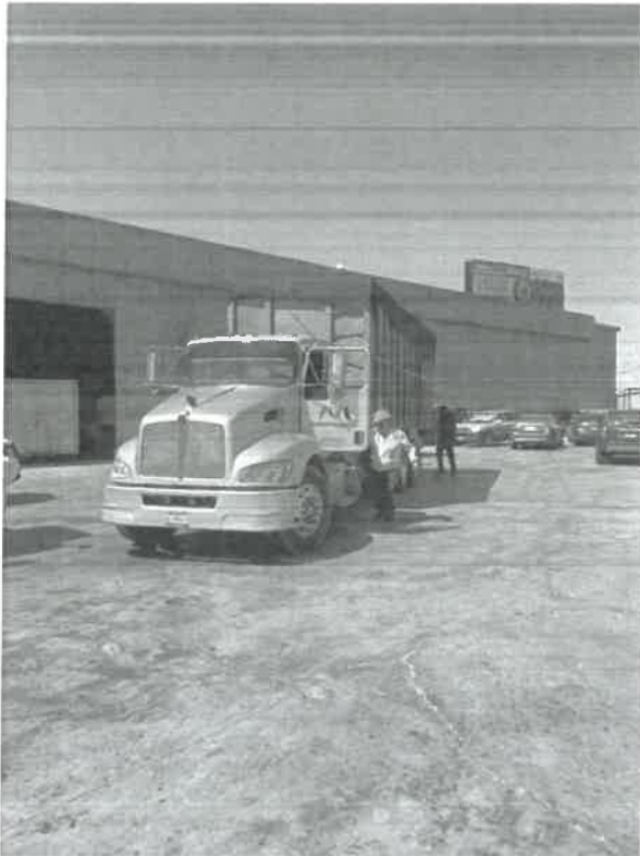
FECHA: 30 de mayo de 2025 LUGAR: El Porvenir, 21185 Mexicali, Baja California