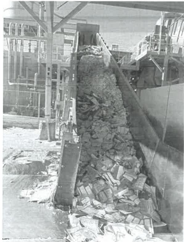
FECHA: 06 de junio de 2025 LUGAR: Islas Agrarias km 10.5, Colonia Mariano Abasolo, Mexicali, Baja California.