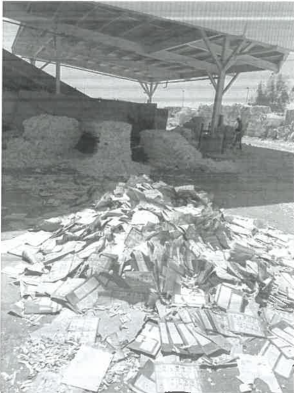
FECHA: 03 de junio de 2025 LUGAR: Islas Agrarias km 10.5, Colonia Mariano Abasolo, Mexicali, Baja California.