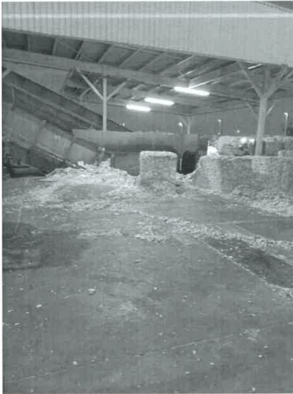
FECHA: 06 de junio de 2025 LUGAR: Islas Agrarias km 10.5, Colonia Mariano Abasolo, Mexicali.