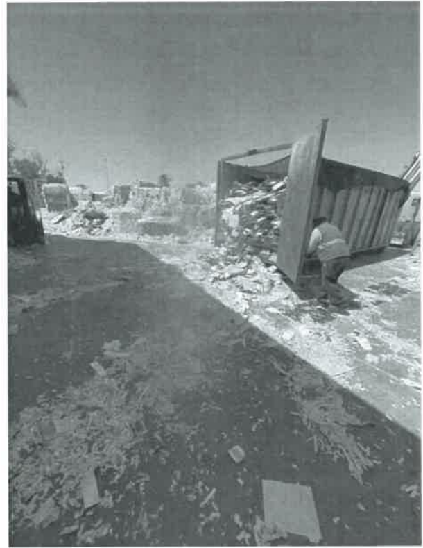
FECHA: 03 de junio de 2025. LUGAR: Islas Agrarias km 10.5, Colonia Mariano Abasolo.