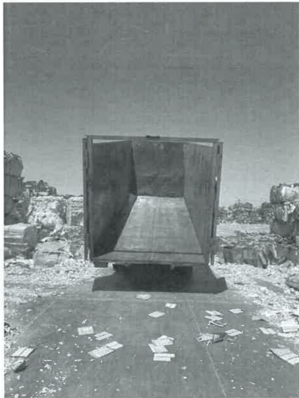
FECHA: 06 de junio de 2025 LUGAR: Islas Agrarias km 10.5, Colonia Mariano Abasolo, Mexicali.