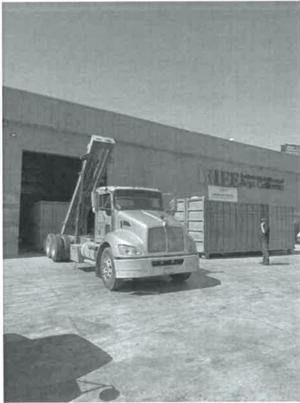
FECHA: 30 de mayo de 2025. LUGAR: El Porvenir, 21185 Mexicali. B. C