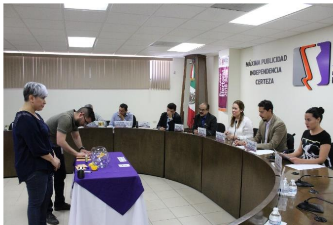
Primer sorteo realizado ante la presencia de los integrantes de la CEDLyD y representantes de los partidos políticos. Sala de Sesiones del Consejo General Electoral. Mexicali, Baja California, a 18 de abril de 2019.