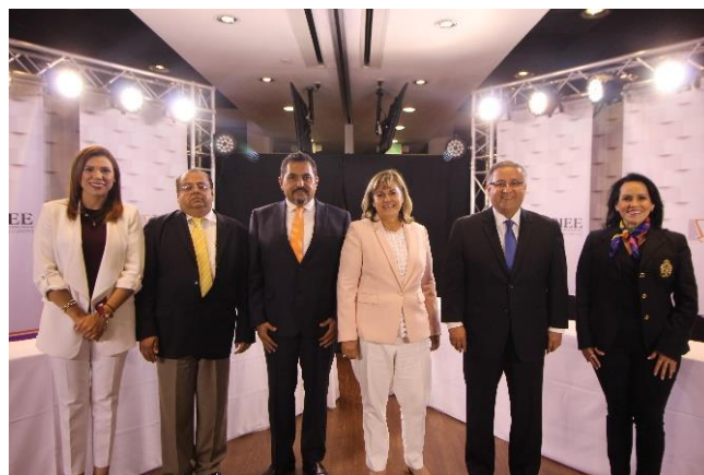
Candidatos y Candidatas asistentes al debate a la Alcaldía de Mexicali. Instalaciones de CETYS Universidad, Campus Mexicali. Mexicali, Baja California, a 14 de mayo de 2019.