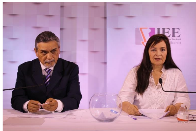
La Moderación del Debate a la Alcaldía de Ensenada. Instalaciones de CETYS Universidad, Campus Mexicali. Mexicali, Baja California, a 15 de mayo de 2019.