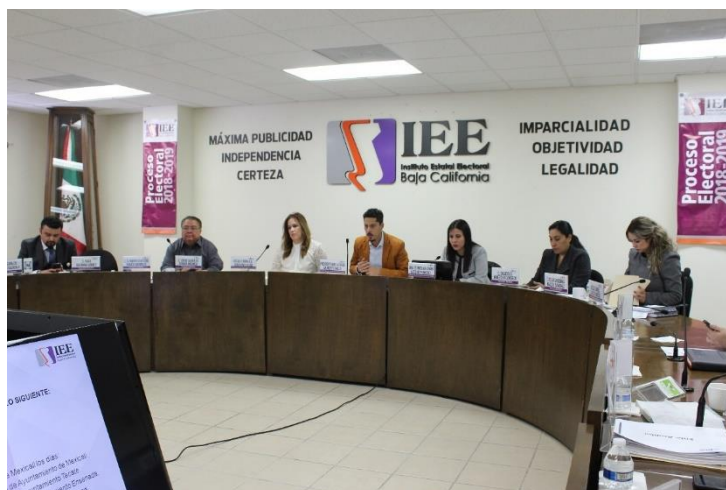
Reunión de trabajo de la CEDlyD. Sala de Sesiones del Consejo General Electoral. Mexicali, Baja California, a 15 de marzo de 2019.

El 19 de marzo de 2019, la CEDlyD celebró sesión de dictaminación con el objeto de revisar el proyecto de Dictamen número uno por el que se aprobaron “Las reglas básicas para la realización de los debates entre las y los candidatos a la Gubernatura y Ayuntamientos del Estado durante el Proceso Electoral Local Ordinario 2018-2019”.