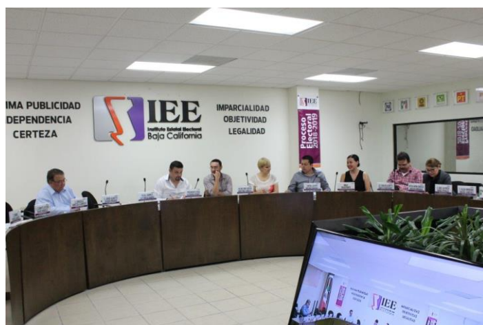
Sesión del Comité de Adquisiciones, Arrendamientos y Servicios del IEEBC. Sala de Sesiones del Consejo General Electoral del IEEBC. Mexicali, Baja California, a 16 de abril de 2019.

Una vez que se dio lectura a cada una de las propuestas, el Comité determinó el fallo de la invitación, otorgando el contrato a “Media Consultores” para brindar el servicio de producción y realización de ocho debates del Instituto Estatal Electoral de Baja California, tres para la elección de Gubernatura del Estado y cinco para las elecciones de los cinco Ayuntamientos.