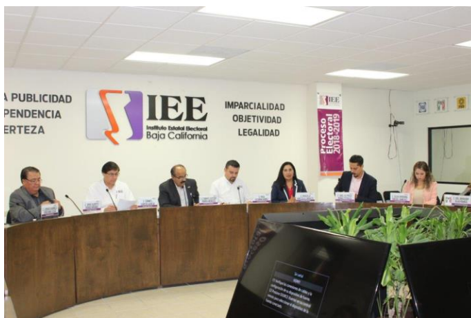
Tercera Sesión Ordinaria del Consejo General del IEEBC. Sala de Sesiones del Consejo General Electoral del IEEBC. Mexicali, Baja California, a 8 de noviembre de 2018.

El 8 de noviembre de 2018, el Consejo General durante la tercera sesión ordinaria aprobó la creación de la CEDlyD mediante el punto de acuerdo IEEBC-CG-PA10-2018.