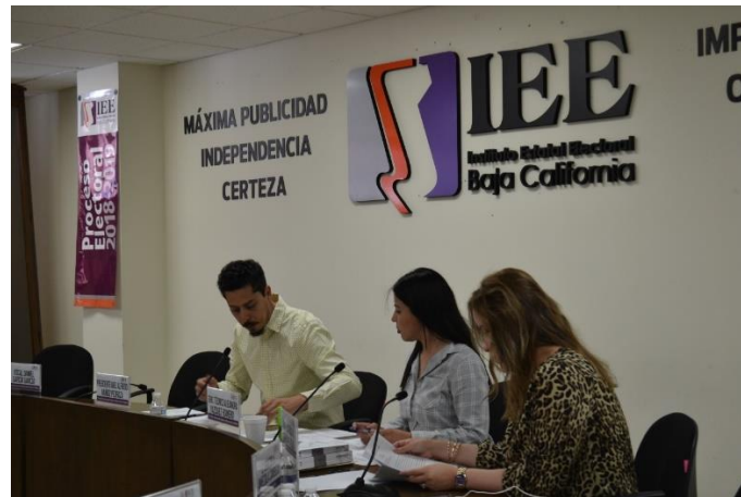
Integrantes de la CEDlyD durante la Sesión de dictaminación. Sala de Sesiones del Consejo General Electoral. Mexicali, Baja California, a 29 de marzo de 2019.

El 15 de abril de 2019, la CEDlyD celebró Reunión de Trabajo con el objeto de revisar en primer punto la “Presentación de la propuesta de moderadoras y moderadores propietarios y suplentes del primer debate para el cargo de Gubernatura y los debates al cargo de Diputación por el principio de mayoría relativa del Instituto Estatal Electoral de Baja California”.