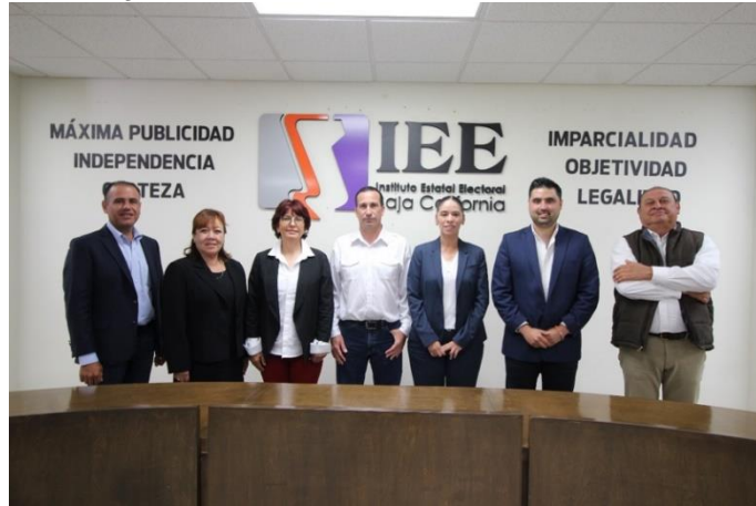
Candidatas y candidatos asistentes al Debate y moderador. Sala de Sesiones del Consejo General Electoral. Mexicali, Baja California, a 5 de mayo de 2019