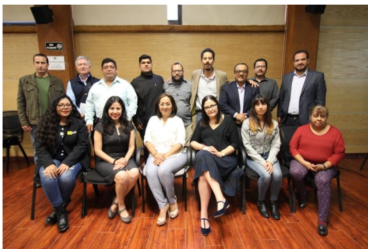
Presidente de la CEDlyD, representantes del INE y periodistas asistentes al taller. Instalaciones de El Colef. Tijuana, Baja California, a 24 de abril de 2019.