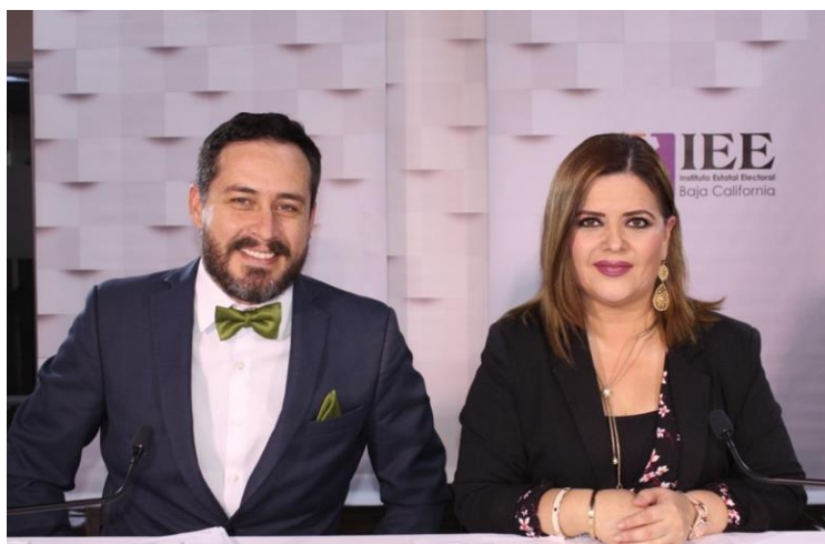
Moderación del Tercer Debate a la Gubernatura del Estado. Instalaciones de UABC Campus Ensenada. Ensenada, Baja California, a 20 de mayo de 2019.