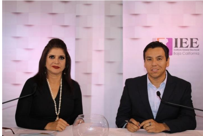
Moderación del Debate a la Alcaldía de Mexicali. Instalaciones de CETYS Universidad, Campus Mexicali. Mexicali, Baja California, a 14 de mayo de 2019.