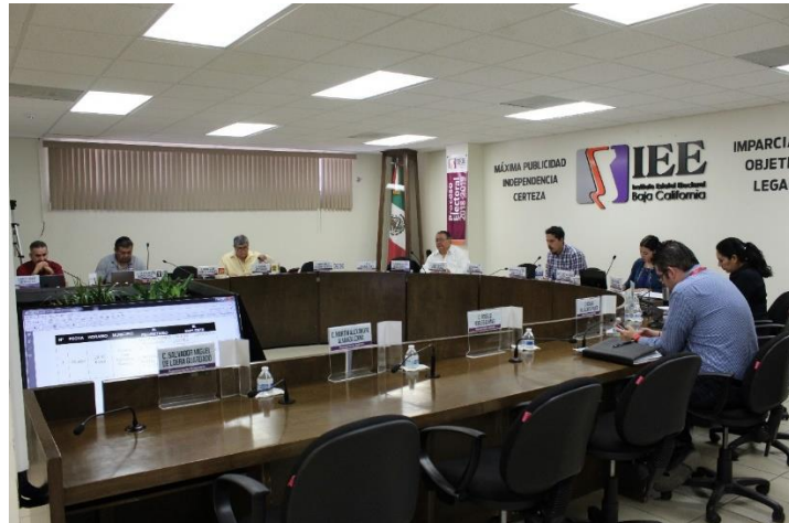
Integrantes de la CEDiD durante reunión de trabajo. Sala de Sesiones del Consejo General Electoral. Mexicali, Baja California, a 15 de abril de 2019.

El 18 de abril de 2019, la CEDiD celebró reunión pública para determinar el orden de participación de las personas que fungieron como moderadoras y moderadores para el primer debate a la gubernatura, así como la realización del sorteo para determinar el orden de ubicación de los candidatos para el primer debate a la gubernatura.