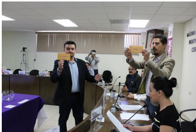
Presidente de la CEDlyD realiza la entrega de los dos sobres cerrados al Secretario Ejecutivo del IEEBC, de la intervención de la moderación del primer debate a la gubernatura. Sala de Sesiones del Consejo General Electoral. Mexicali, Baja California, a 18 de abril de 2019.

El 22 de abril de 2019, la CEDlyD celebró reunión pública para determinar el orden de ubicación de las y los candidatos para los debates al cargo de las diputaciones locales por el principio de Mayoría Relativa mediante sorteo, quedado de la siguiente manera: