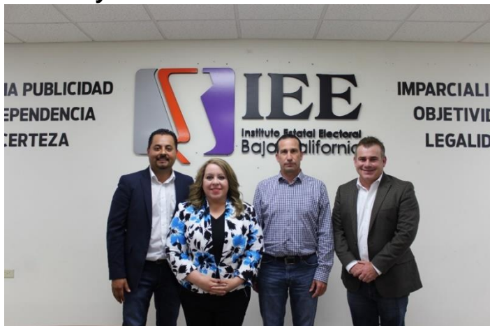
Candidata y candidatos asistentes al Debate y moderador. Sala de Sesiones del Consejo General Electoral. Mexicali, Baja California, a 7 de mayo de 2019