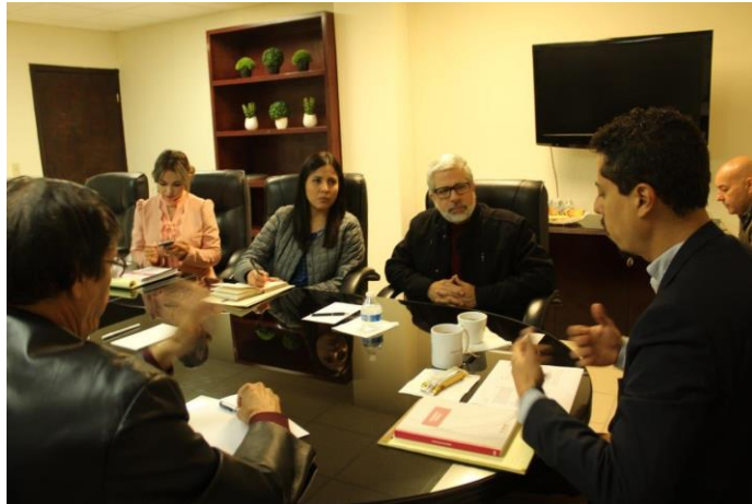
Reunión de trabajo de la CEDLyD y CIRT. Sala de Consejeros del IEEBC Mexicali, Baja California, a 16 de enero de 2019.

Por otra parte, se giraron los siguientes oficios para solicitar de su apoyo en la transmisión de los debates que organizó el Instituto Electoral atendiendo lo dispuesto en los párrafos 4 y 5 del señalado artículo 218 de la Ley General de Instituciones y Procedimientos Electorales: