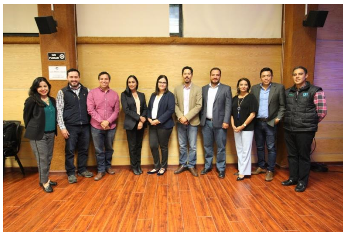
Presidente de la CEDyD, representantes del INE y periodistas asistentes al taller. Instalaciones de El Colef. Tijuana, Baja California, a 23 de abril de 2019.

En el taller del 24 de abril de 2019 se contó con la presencia de las siguientes personas: