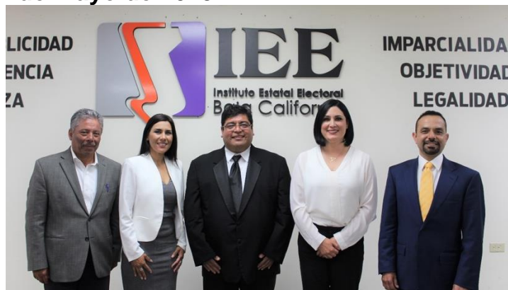
Candidatas y candidatos asistentes al Debate y moderador. Sala de Sesiones del Consejo General Electoral. Mexicali, Baja California, a 4 de mayo de 2019