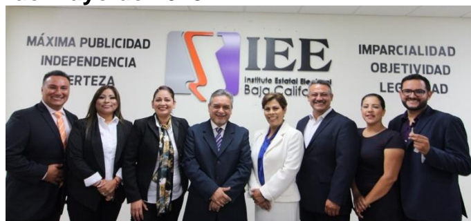
Candidatas y candidatos asistentes al Debate y moderador. Sala de Sesiones del Consejo General Electoral. Mexicali, Baja California, a 2 de mayo de 2019