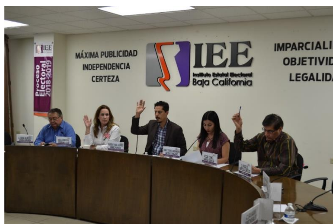
Integrantes de la CEDLyD durante Sesión de dictaminación. Sala de Sesiones del Consejo General Electoral. Mexicali, Baja California, a 8 de mayo de 2019.

Lo anterior a efecto de otorgar un minuto más a cada una de las intervenciones en los debates de los candidatos a la gubernatura y las y los candidatos a municipales, para asegurar y garantizar las condiciones de equidad y trato igualitario en cuanto al desarrollo de los debates, y que las y los participantes logran exponer y confrontar entre sí sus propuestas, planteamientos y plataformas electorales, como parte de un ejercicio democrático que tuvo como objetivo proporcionar a la sociedad la difusión y confrontación de las ideas, programas y plataformas de cada candidatura.