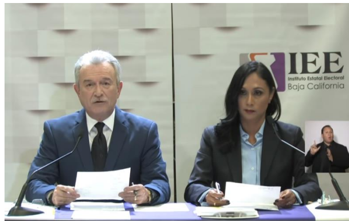
Moderación del Primer Debate a la Gubernatura del Estado. Instalaciones de El Colef. Tijuana, Baja California, a 28 de abril de 2019.

El formato del segundo debate a la Gubernatura contó con la intervención de la ciudadanía mediante preguntas hechas a través redes sociales y correo electrónico. El debate se dividió en dos bloques que a su vez se desagregaron en dos segmentos. En el segmento uno del primer y segundo bloque temático, la moderación realizó una pregunta a todos los debatientes, la cual reflejó la percepción de la sociedad. Además, hubo preguntas de seguimiento por parte de la moderación. En el segundo segmento del primer y segundo bloque temático se buscó la interacción entre todos los candidatos con bolsa de tiempo de hasta dos minutos por cada uno. Para cerrar el debate, los candidatos tuvieron una intervención para dar su mensaje de conclusión, quienes tuvieron voz hasta por un minuto y medio.