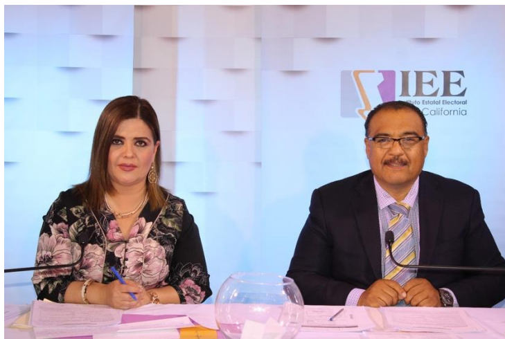
Moderación del Debate a la Alcaldía de Playas de Rosarito. Instalaciones de CETYS Universidad, Campus Mexicali. Mexicali, Baja California, a 17 de mayo de 2019.