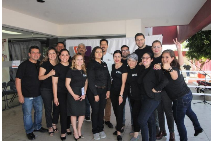
Personal del IEEBC que colaboró en la organización y realización de los debates durante el Proceso Electoral 2018-2019. Instalaciones del IEEBC. Mexicali, Baja California, del 2 al 7 de mayo de 2019.