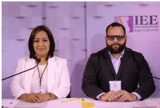
Moderación del Debate a la Alcaldía de Tecate. Instalaciones de CETYS Universidad, Campus Mexicali. Mexicali, Baja California, a 16 de mayo de 2019.