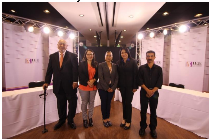
Candidatos y Candidatas asistentes al Debate a la Alcaldía de Tecate. Instalaciones de CETYS Universidad, Campus Mexicali. Mexicali, Baja California, a 17 de mayo de 2019.