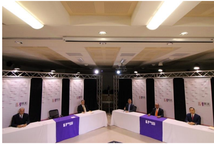
Candidatos asistentes al primer debate a la Gubernatura del Estado. Instalaciones de El Colef. Tijuana, Baja California, a 28 de abril de 2019.