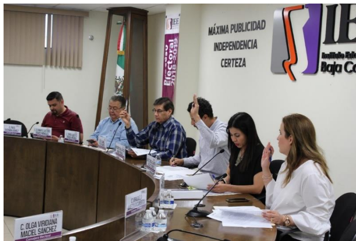
Integrantes de la CEDLyD durante Sesión de dictaminación. Sala de Sesiones del Consejo General Electoral. Mexicali, Baja California, a 26 de abril de 2019.

El día 8 de mayo de 2019, la CEDLyD celebró sesión de dictaminación con el objeto de revisar el Proyecto de dictamen número 6 por el que “Se modifican los lineamientos específicos para los debates del Instituto Estatal Electoral de Baja California, correspondientes al Proceso Electoral Local Ordinario 2018-2019”.