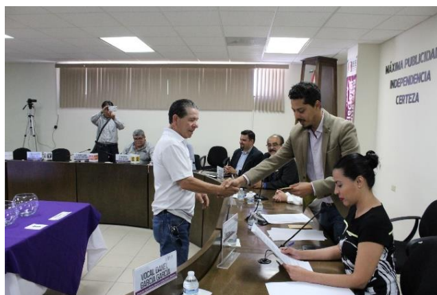
Presidente de la CEDLyD realiza la entrega de sobre cerrado al representante del moderador del primer debate a la gubernatura. Sala de Sesiones del Consejo General Electoral. Mexicali, Baja California, a 18 de abril de 2019.