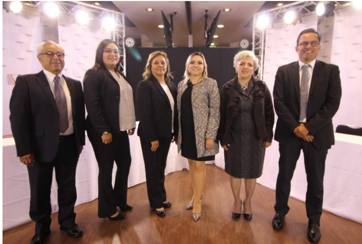
Candidatos y Candidatas asistentes al Debate a la Alcaldía de Tecate. Instalaciones de CETYS Universidad, Campus Mexicali. Mexicali, Baja California, a 16 de mayo de 2019.