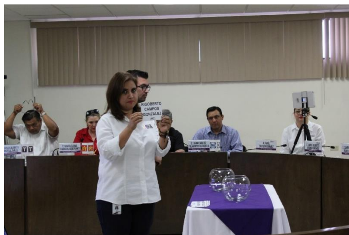
Personal de apoyo durante la realización del sorteo de ubicación de las y los candidatos en reunión pública de la CEDlyD. Sala de Sesiones del Consejo General Electoral. Mexicali, Baja California, a 22 de abril de 2019.

El 26 de abril de 2019, la CEDlyD celebró sesión de dictaminación con el objeto de revisar el proyecto de Dictamen número cinco por el que se aprobaron “Las moderadoras y los moderadores propietarios y suplentes del segundo y tercer debate al cargo de Gobernatura y de los debates para los cargos de Municipales de los Ayuntamientos de Ensenada, Mexicali, Playas de Rosarito, Tecate y Tijuana, organizados por el Instituto Estatal Electoral de Baja California, correspondientes al Proceso Electoral Local Ordinario 2018-2019”.