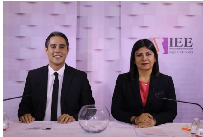
Moderación del Debate a la Alcaldía de Tijuana. Instalaciones de CETYS Universidad, Campus Mexicali. Mexicali, Baja California, a 13 de mayo de 2019.