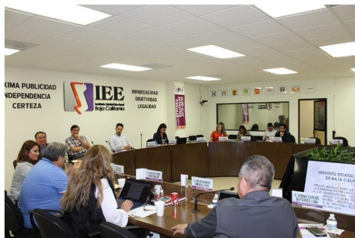
Reunión de trabajo de la CEDIyD. Sala de Sesiones del Consejo General Electoral. Mexicali, Baja California, a 8 de marzo de 2019.

El 8 y 15 de marzo de 2019, la Comisión celebró reunión de trabajo en la que las y los representantes de los partidos políticos manifestaron sus inquietudes conforme al presupuesto para la celebración de un mayor número de debates.