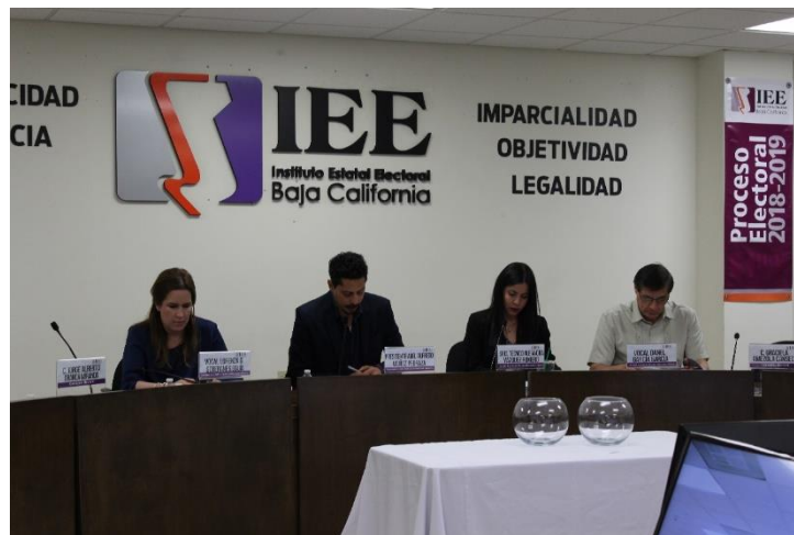
Integrantes de la CEDlyD durante reunión pública. Sala de Sesiones del Consejo General Electoral. Mexicali, Baja California, a 10 de mayo de 2019.

El 10 de mayo de 2019, la Comisión celebró reunión pública para determinar el orden de participación de la moderación para el tercer debate entre los candidatos al cargo de la Gobernatura del Estado.