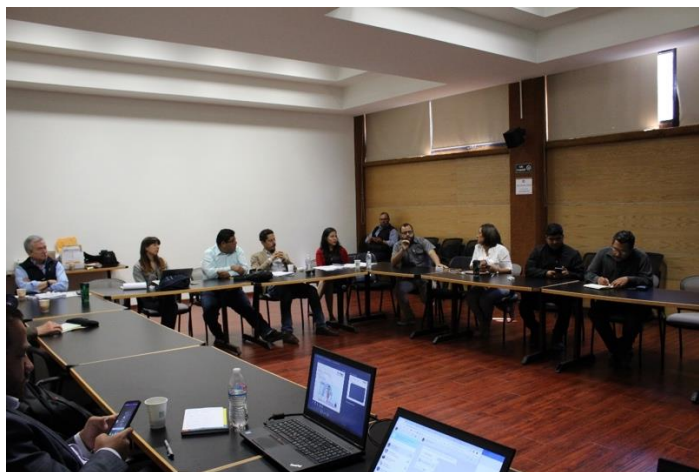
Presidente de la CEDlyD, representantes del INE y periodistas asistentes al taller. Instalaciones de El Colef. Tijuana, Baja California, a 24 de abril de 2019.