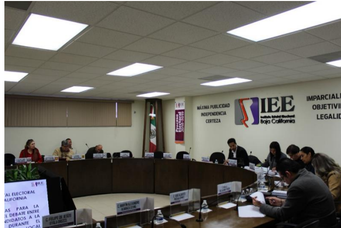
Reunión de trabajo de la CEDIyD. Sala de Sesiones del Consejo General Electoral. Mexicali, Baja California, a 15 de enero de 2019.

la realización del debate entre las y los candidatos a la Gubernatura durante el Proceso Electoral Local Ordinario 201-2019”. Durante esta reunión, se propuso la realización de un debate para el cargo de la Gubernatura del Estado, quedando en evaluación la posibilidad de incrementar el número de debates a este cargo.