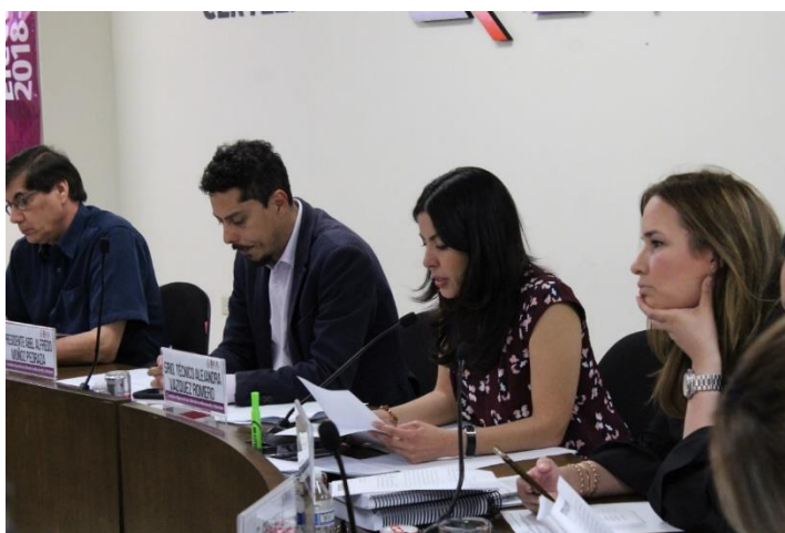
Integrantes de la CEDlyD durante la Sesión de dictaminación. Sala de Sesiones del Consejo General Electoral. Mexicali, Baja California, a 19 de marzo de 2019.

El 19 de marzo de 2019, la CEDlyD celebró sesión de dictaminación con el objeto de revisar el proyecto de Dictamen número uno por el que se aprobaron “Las reglas básicas para la realización de los debates entre las y los candidatos a la Gubernatura y Ayuntamientos del Estado durante el Proceso Electoral Local Ordinario 2018-2019”.