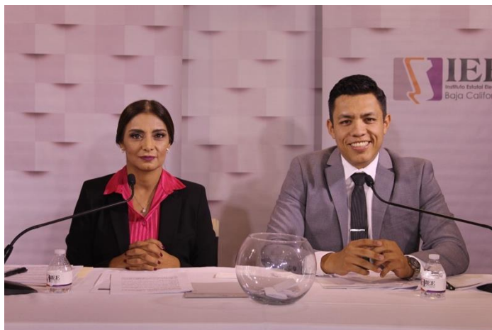
Moderación del Segundo Debate a la Gubernatura del Estado. Instalaciones de Cetys Universidad Campus Mexicali. Mexicali, Baja California, a 12 de mayo de 2019.

El formato del tercer debate a la Gubernatura se dividió en dos bloques que a su vez se desagregaron en dos segmentos. El segmento uno del primer y segundo bloque contó con la intervención del alumnado universitario, mediante preguntas hechas en video con una duración de 30 segundos. En el caso del primer segmento, la moderación presentó un video de un estudiante, pregunta que fue respondida por cada uno de los debatientes.