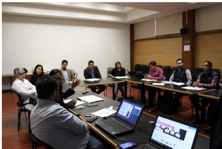
Presidente de la CEDyD, representantes del INE y periodistas asistentes al taller. Instalaciones de El Colef. Tijuana, Baja California, a 23 de abril de 2019.