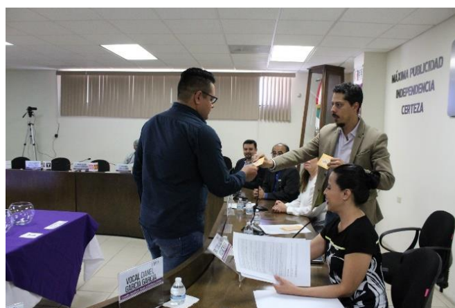
Presidente de la CEDLyD realiza la entrega de sobre cerrado al representante de la moderadora del primer debate a la gubernatura. Sala de Sesiones del Consejo General Electoral. Mexicali, Baja California, a 18 de abril de 2019.