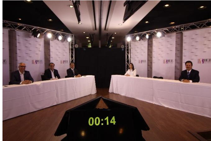
Candidatos y Candidatas asistentes al debate a la Alcaldía de Tijuana. Instalaciones de CETYS Universidad, Campus Mexicali. Mexicali, Baja California, a 13 de mayo de 2019.