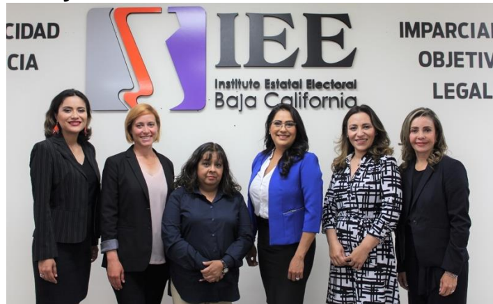
Candidatas asistentes al Debate y moderador. Sala de Sesiones del Consejo General Electoral. Mexicali, Baja California, a 5 de mayo de 2019