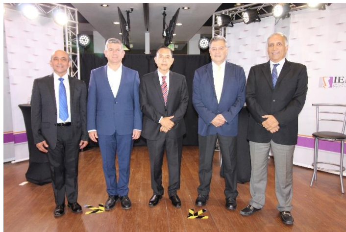
Candidatos asistentes al segundo debate a la Gubernatura del Estado. Instalaciones de Cetys Universidad. Mexicali, Baja California, a 12 de mayo de 2019.

En el tema combate a la corrupción, transparencia y rendición de cuentas se recibieron preguntas, de las cuales, se dividieron en mecanismos anticorrupción y gobierno abierto e instrumentos de participación ciudadana.